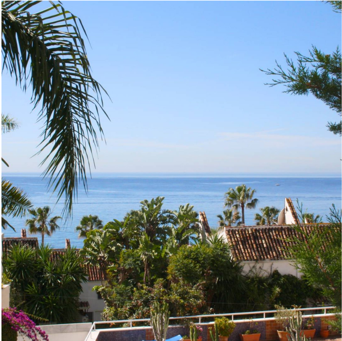
Property in Marbella